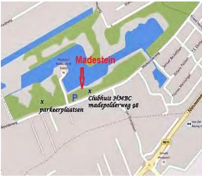
Locatie van HMBC Den Haag-zuid op Madestein aan de Madepolderweg 98.