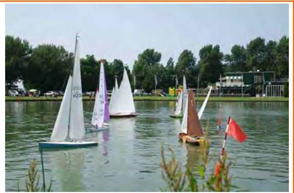
Rechter foto: Modelzeilen bij HMBC op Madestein in Den Haag.