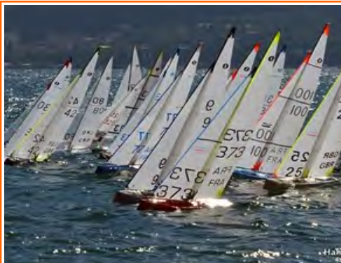
Linker foto: Internationale Marblehead wedstrijd. Veel drukte en dringen na de start.