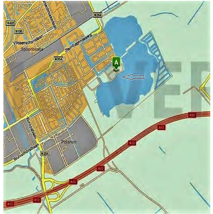
Modelzeillocatie VMBC t'Anker Cattenbroekerplas in Woerden. Adres: Meer van Anncy 22