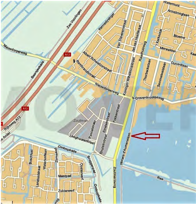
Locatie Open NK Marblehead Reeuwijk-brug bij de Goudse roei- en zeilvereniging. Organisatie Radiozeilen Nederland. Zie agenda blz.1